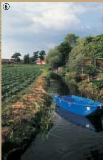
Location de barques, marais de Nieurlet.

vue l'Aa, le canal de Bourbourg et le canal de la Haute-Colme. Sur ces terres, riches en tourbes, l'Homme a façonné un paysage composé d'étangs, de fossés, de prairies, de parcelles de maraîchage et d'alignement de saules ; donc des terres propices à la culture. Le site de Romelaere, ancienne zone d'exploitation classée aujourd'hui en Réserve Naturelle Volontaire sur 82 hectares, accueille une quantité d'oiseaux nicheurs et hivernants tels que les cormorans, butors, blongios, canards, busards des roseaux et passereaux des roselières. Au printemps, le marais est animé par le coassement des batraciens.