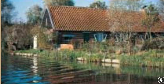
Marais de Nieurlet. Habitat traditionnel.