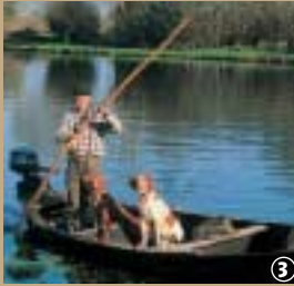
Marais de Nieurlet.

Frontière entre le Nord et le Pas-de-Calais, le marais audomarois trouve son origine à l'époque Gallo-romaine. La mer s'engouffrait alors jusqu'à Watten et Saint-Omer était un port actif. Suite à l'érosion et aux changements climatiques, la mer s'est retirée et Watten culmine à 72 m d'altitude. De ce point, s'étendent à perte de