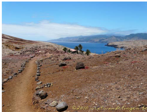
Ponta de Sao Lourenco