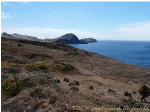
Ponta de Sao Lourenco

Goed om weten: Dit is een van de populairste wandelingen op het eiland. Verwacht dus niet dat het hier rustig wandelen is. Het is dus soms aanschuiven op het nauwe pad om vlot verder te kunnen wandelen. Dit is uiteraard minder prettig.